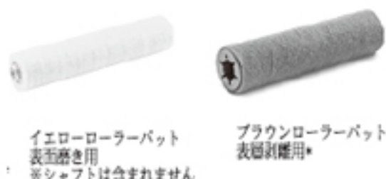
イエローローラーパッド 表面磨き用 ※シャフトは含まれません